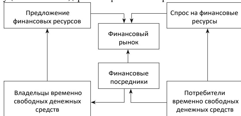
Рис. 3. Механизм функционирования финансового рынка

Механизм функционирования финансового рынка — совокупность функционального и институционального содержания финансового рынка.