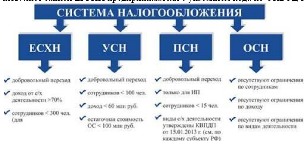
Таблица. Основные полномочия и права налогоплательщиков

Если все документы в порядке, через 3 рабочих дня в налоговой инспекции вы можете получить: лист записи ЕГРИП предпринимателя с указанием кода по ОКВЭД и места.